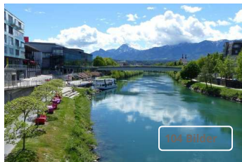
Gut bewertete Bilder zum Thema Villach